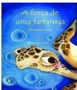
A força de uma Tartaruga Autora: Hosana Costa Editora: Franco