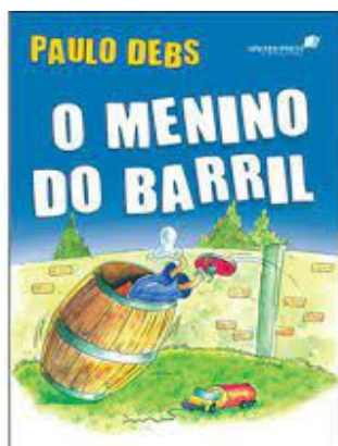
O menino do Barril Autor: Paulo Debs Debs Editora