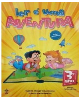
Autora: Suzete Araújo Águas Maia.

Editora: Casa Publicadora Brasileira-CPB Livraria Cristã